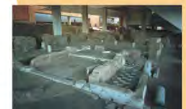
Área Arqueológica de Morería

EXCONVENTO DE SANTO DOMINGO. Mandado construir por los padres dominicos, se terminó en 1636. Hoy, prácticamente en ruinas, cabe resaltar la fachada de su iglesia.