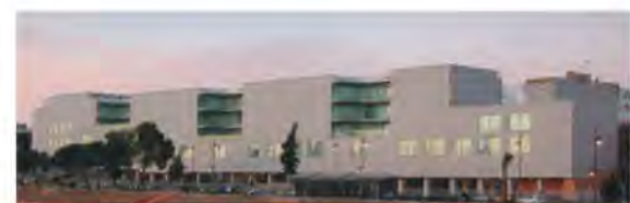
Edif. Nuevas Consejerías