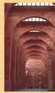
Museo Nacional de Arte Romano