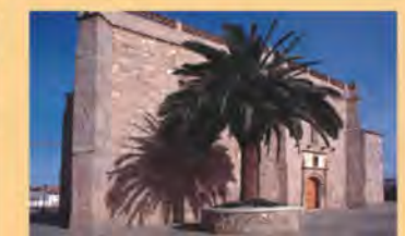
Ermita de Nuestra Señora de la Antigua